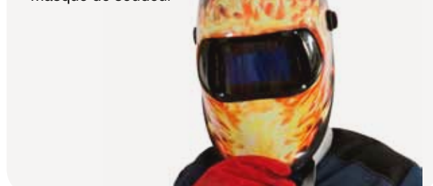
Fig. 6 Masque de soudeur

Le masque de soudeur protège le visage et le cou des rayonnements de l'arc et des projections incandescentes. Il est constitué d'un écran en matière ininflammable (fibre vulcanisée, polyester armé de fibres