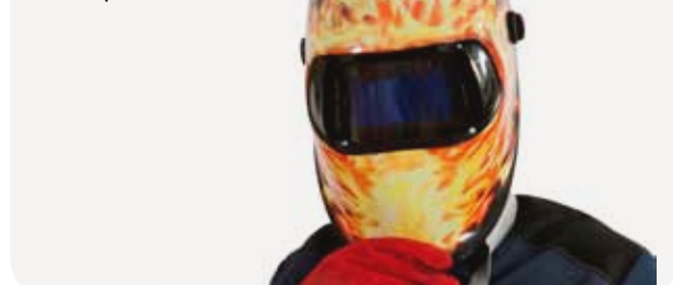
Fig. 6 Masque de soudeur

Le masque de soudeur protège le visage et le cou des rayonnements de l'arc et des projections incandescentes. Il est constitué d'un écran en matière ininflammable (fibre vulcanisée, polyester armé de fibres