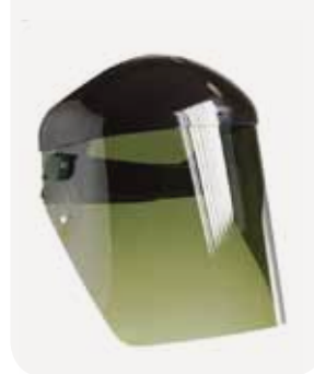
Fig. 4 Écran facial