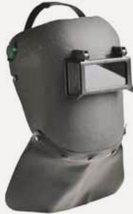
Fig. 7 Masque de soudeur maintenu par serre-tête - NORTH SAFETY

sur la tête par un serre-tête adaptable ou un casque de protection (Fig. 7).