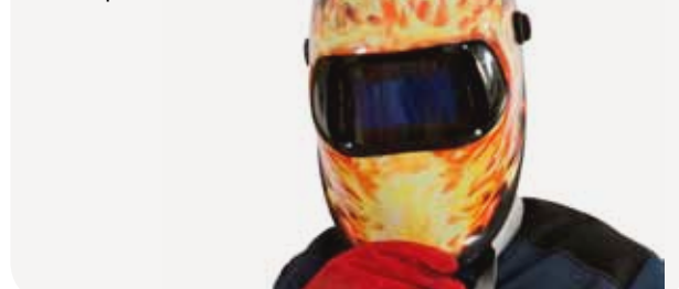
Fig. 6 Masque de soudeur

Le masque de soudeur protège le visage et le cou des rayonnements de l'arc et des projections incandescentes. Il est constitué d'un écran en matière ininflammable (fibre vulcanisée, polyester armé de fibres